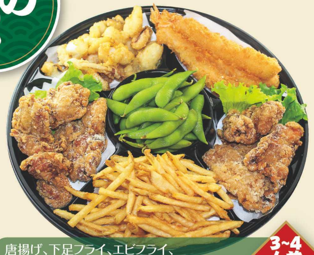
唐揚げ、下足フライ、エビフライ、 フライドポテト、枝豆